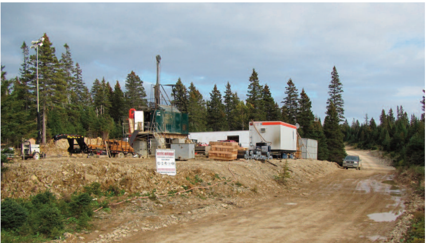
Site de Lac Martin.